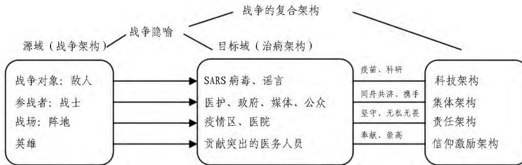
图2 SARS报道中的战争复合架构

非典中后期,“战争”是报道的主旨。战争类词,如“敌人 112.312”“战士 302.581”“指挥部 55.065”等激活了战争这一表层架构,与防治非典相关的“医生”“病人”“疫情区”等词激活了治病的表层架构。从源域战争架构到目标域治病架构映射的神经回路形成了“防治非典是战争”这一概念隐喻,渲染了战争场景。战争隐喻和一系列架构组成了战争的复合架构 ② 。如图2所示: